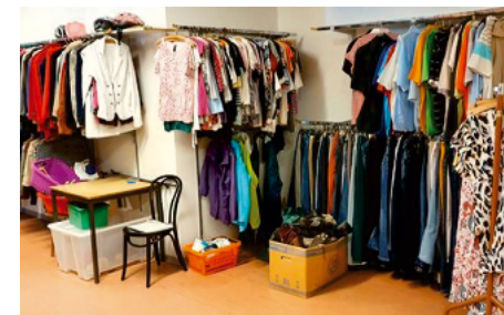
Blick in die Kleiderkammer

Ab sofort erfolgt die Annahme von Spenden der Kleiderkammer in der Seniorenresidenz in der Eidelstedter Dorfstraße 19 dienstags und der Verkauf mittwochs jeweils von 16 bis 18 Uhr . Wir nehmen gut erhaltene Kleidung, Haushaltsgegenstände sowie Bücher entgegen.